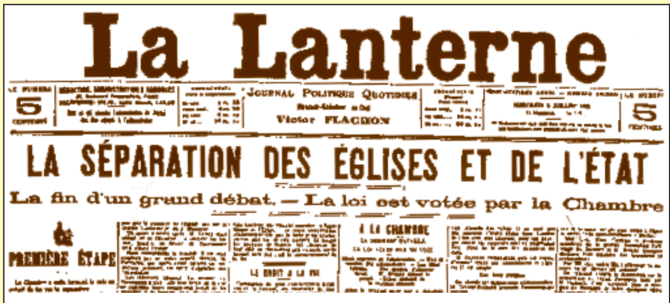
La loi est votée !

réformer le couple Eglise/Etat dans un esprit de revanche contre la République, ses valeurs citoyennes. Certains irons jusqu’au bout dans la collaboration avec l’occupant nazis.