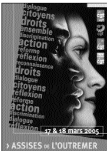
Pages 7,8,9, crédit photo : claude candille

A l'issue des travaux, il se dégage des propositions revendicatives et une forte volonté d'agir ensemble, tenant compte du vécu et de l'avenir pour la deuxième et troisième génération d'originaires. Une nouvelle dynamique est lancée pour des luttes solidaires avec des objectifs d'élargissement et de rassemblement. Elle s'est concrétisée dès le 26 mai, date d'une action coordonnée entre les départements d'outre-mer et l'hexagone.